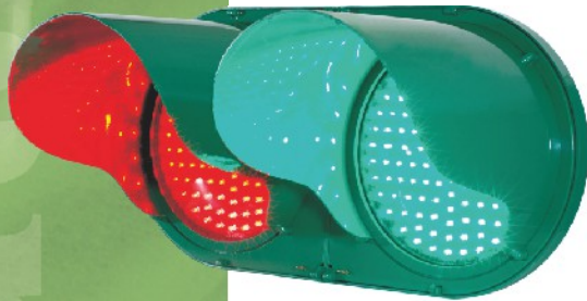
LK-104L (LED 燈箱)