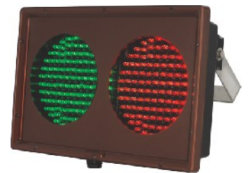
LK-104LS (小型 LED 燈箱)