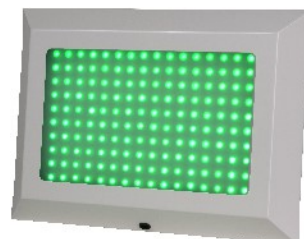
LK-104PS (平板雙色 LED 燈箱)