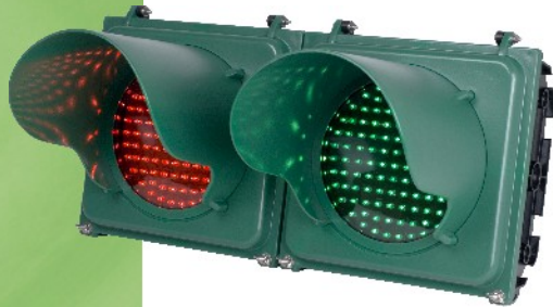
LK-104LM (中型 LED 燈箱)